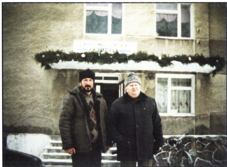
Sărbătoarea „Satul meu vatră frumoasă” la Casa Culturii din Ropcea.