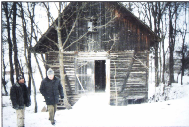
Moară pe apă, constr. 1900. Ropcea

furișat în tindă, de acolo și-a luat toporul și a ieșit în curte. Luna plină de pe cer lumina ca ziua și potența asprimea gerului. Zăpada scârțâia la fiecare pas și reflecta stelute albastre-argintii. În jur – nici țipenie de om. Numai câinele Ursu a apărut parcă de nicăieri și a început să i se gudure pe la picioare și să-i sară până la umăr pentru a-l săruta. De la fântâna din colțul ogrăzii și până la moară era o cale de cinci minute. Odată ajuns aici, și-a dezbrăcat flaneaua și s-a strecurat în marea roată pentru a o debloca, chipurile, din chingile gheții. Și a bătut bunicul cu securea în sloiul de gheață până către dimineață, și de sus, de la lătoc, apa îngheța la loc și îl căpăcea pe nesimțite ca într-o celulă sub formă de om, asemănătoare unei sculpturi abia croite a unui lucrător-pietrar în plin efort.