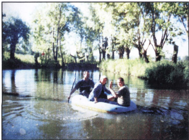
Siretul la Ropcea.

Vasileu – pârâu, izvorăște din dealul Pătrăuțului, străbate partea sud-estică a satului și se varsă în Siret. Este la fel amintit în documentul hotărniciei pentru a patra parte din satul Ropcea, făcută la 2 noiembrie 1762.