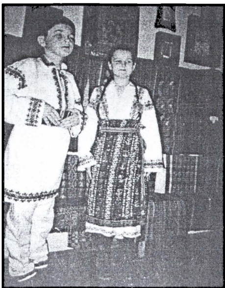
Copii în costume naționale, sat Ropcea.