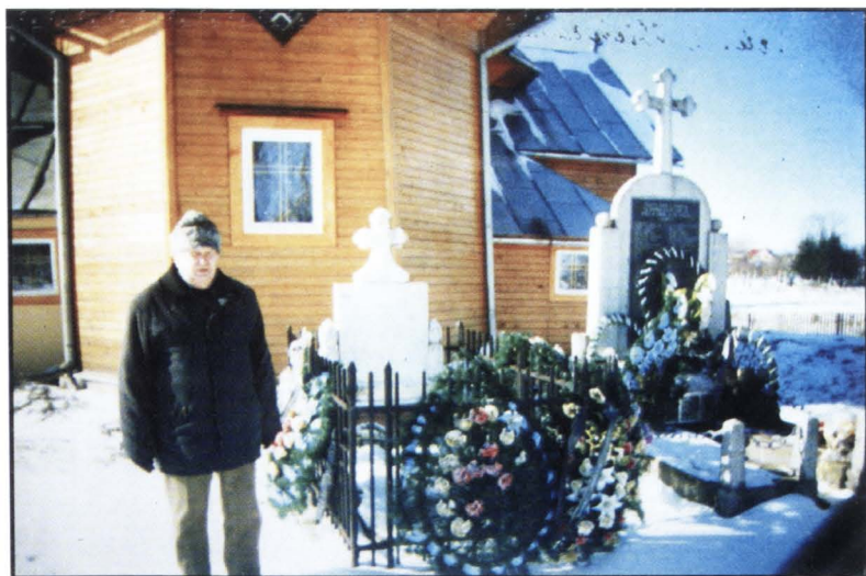
La mormântul lui Iancu Flondor, unificatorul, Storojineț.