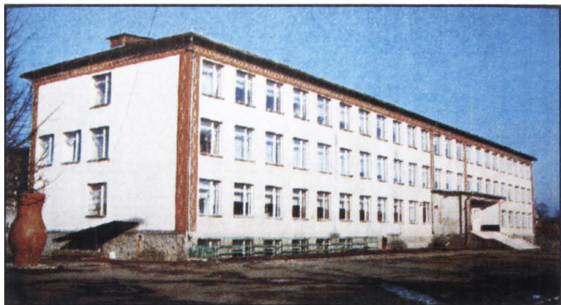
Clădirea Școlii Medii din Ropcea, constr. 1981.