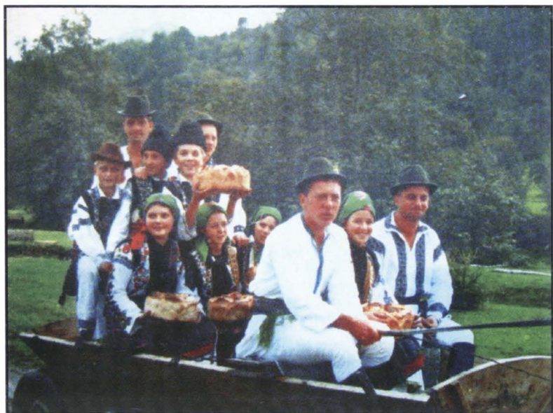
Cu faetonul după mireasă.