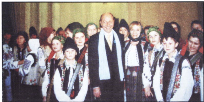
Colectivul folcloric 'Izvoarașul' al copiilor ropceni l-a colindat pe Președintele României Traian Băsescu (2006).

Citiți în paginile următoare câteva episoade privind calvarul ropcenilor.