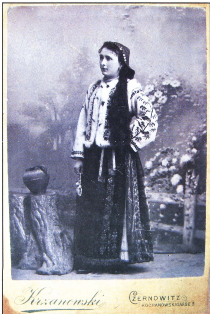
Răzășiță din Ropcea, 1875.

și, ce este foarte important, unele privilegii de la domnii țării. Ei plăteau un impozit mai mic în comparație cu birnicii, aveau unele scutiri la impozitul pe avere și dispuneau de dreptul de a avea argați și slujitori la curte.