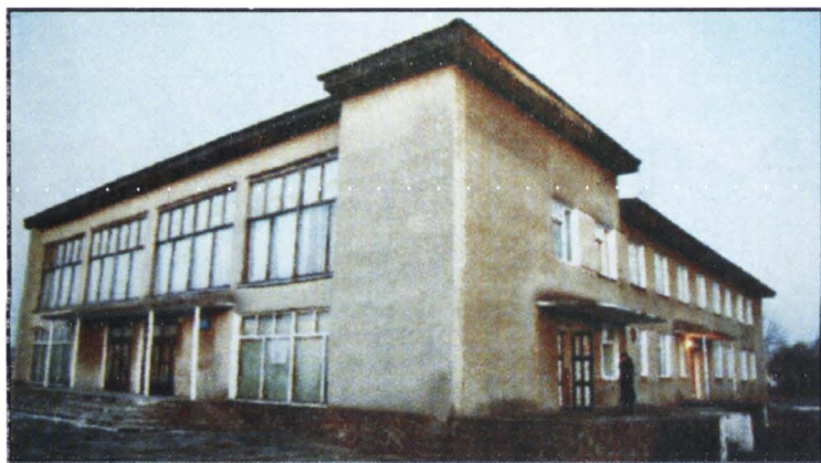
Casa de Cultură din Ropcea.