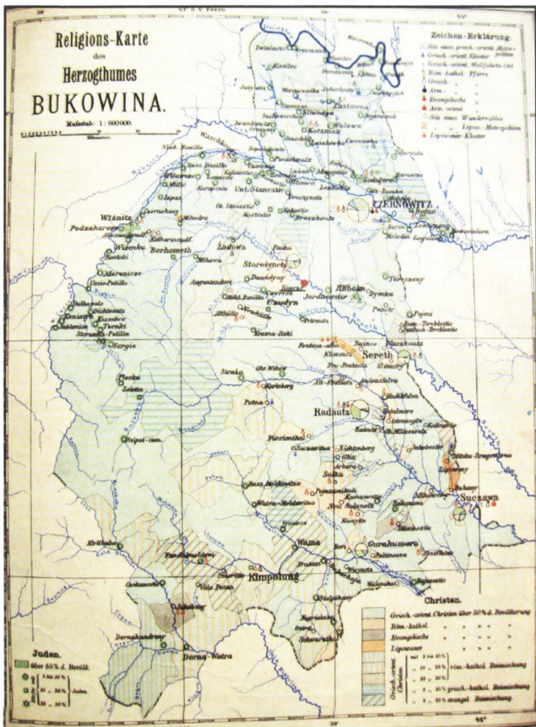
Poziționarea satului Ropcea pe o hartă a Bucovinei de după 1850.